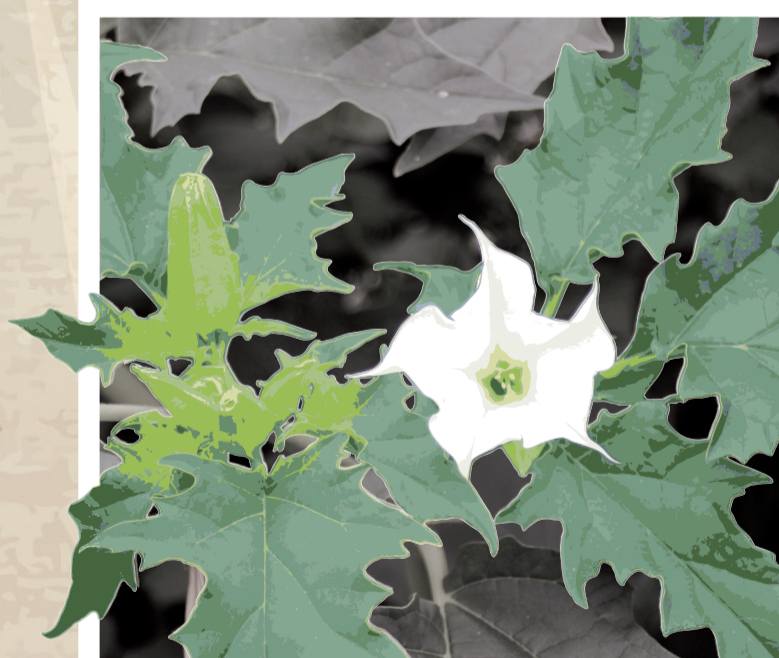
LE DATURA STRAMOINE