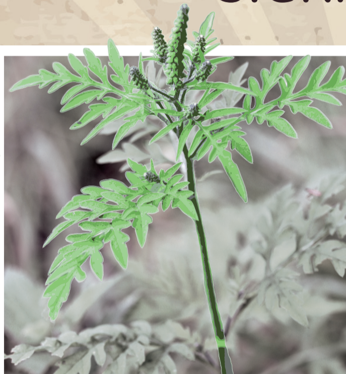
L'AMBROISIE À FEUILLES D'ARMOISE

4 PLANTES INVASIVES DANGEREUSES POUR MA SANTÉ SIGNALEZ-LES !