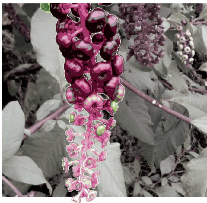
LE RAISIN D'AMÉRIQUE