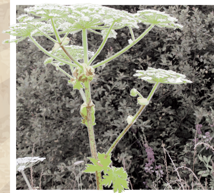
LA BERCE DU CAUCASE